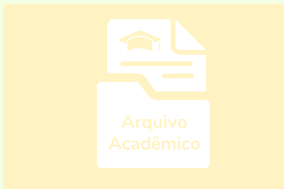
Uso de negativo em fundo claro

Utilizações vetadas se caracterizam por usos que não são permitidos para a marca, seja ela prioritária ou auxiliar. Não é permitido o uso da marca em sua originalidade de grafia e cores em fundos coloridos, recomenda-se o uso da monocromia ou marca auxiliar podendo ser em monocromia ou cor original da marca. Não é recomendado o uso do símbolo de forma isolada. Não fazer o uso da marca de forma a gerar distorção da mesma, erro na proporção, uso em outline ou alteração de qualquer componente ou símbolo da composição visual da marca como um todo incluindo a versão com texto de suporte.