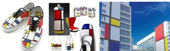
Áreas influenciadas pela obra do artista

Caracterizado pelo trabalho com obras abstratas geométricas, principalmente com formatos retangulares nas cores primárias – vermelho, azul, branco, preto e amarelo –, a influência de suas obras estende-se até hoje em diversos campos: moda, projeto de produto, arquitetura e artes gráficas (Centro Cultural Banco do Brasil, 2016).