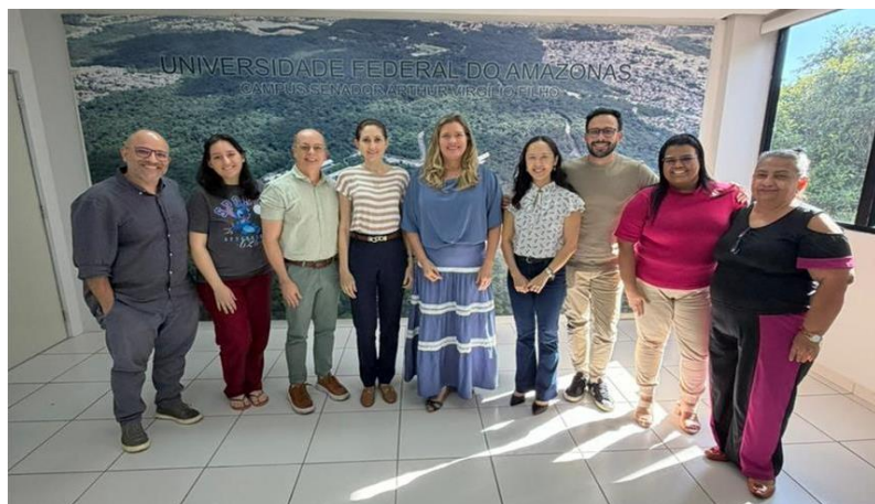
Figura 3: Reunião de servidores e discente da FAO com a Reitora da UFAM