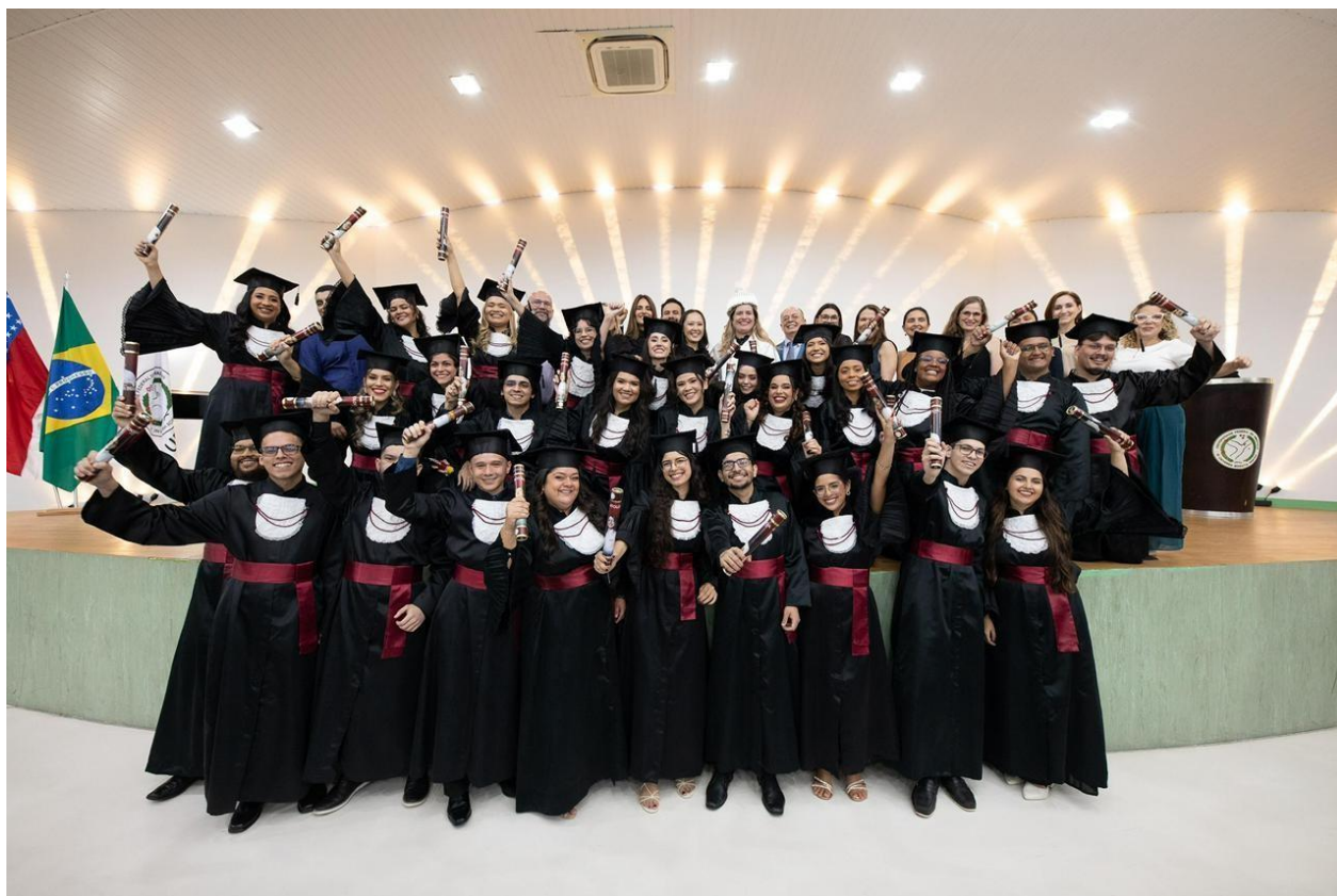
Figura 1: formandos turma 2025.2