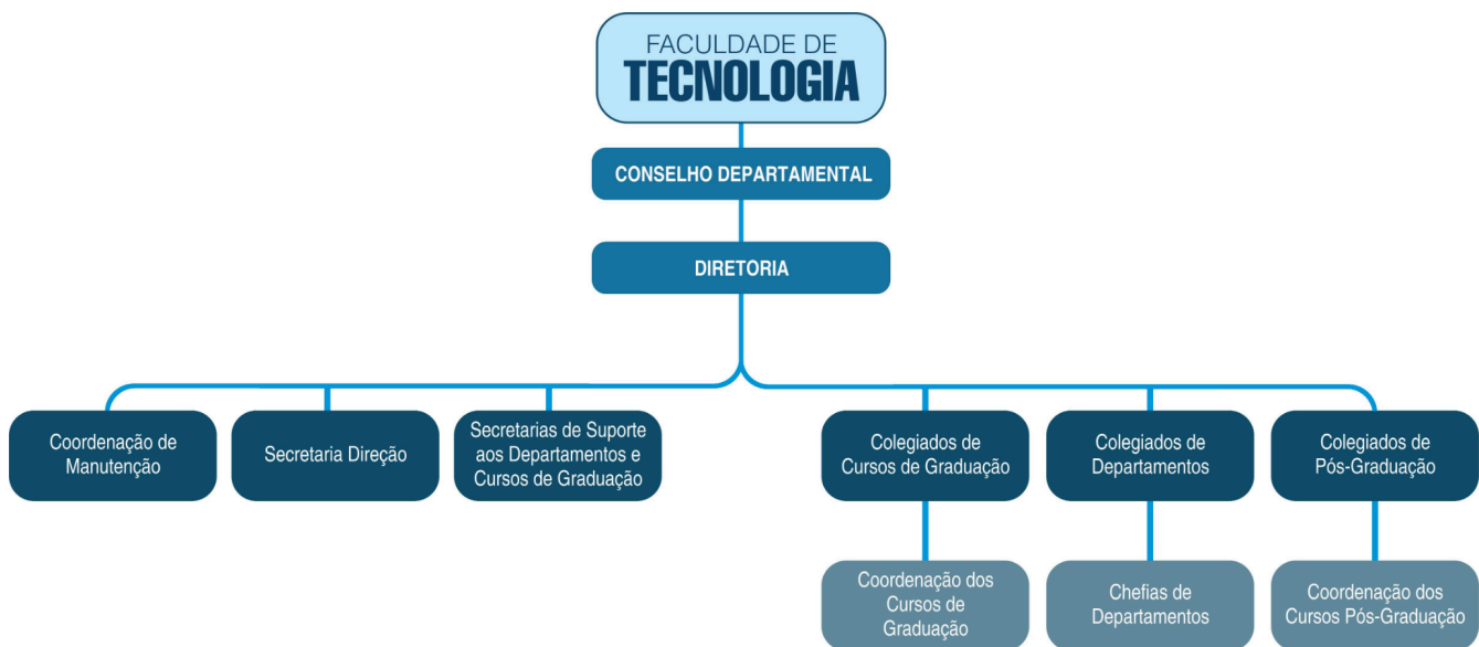
Figura 1 - Estrutura Organizacional da Faculdade de Tecnologia.