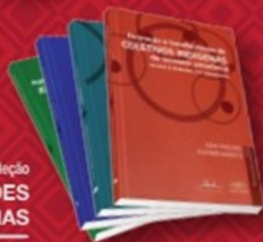
Coleção REFLEXIVIDADES INDÍGENAS