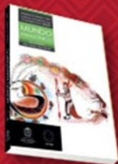
Revista MUNDO AMAZONICO vol. 10/1 (2019)